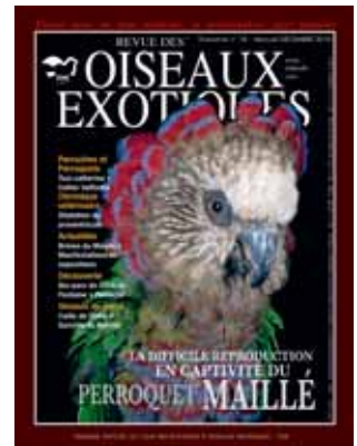
Perroquet maillé